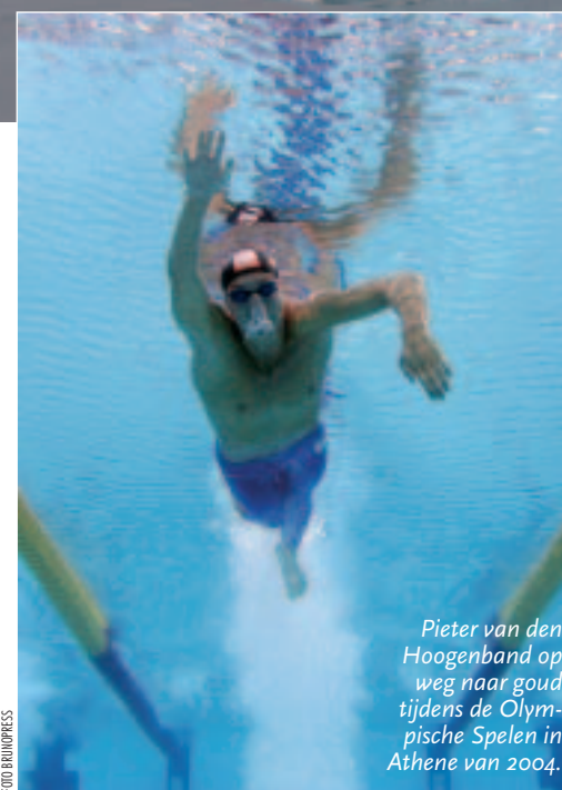
Pieter van den Hoogenband op weg naar goud tijdens de Olympische Spelen in Athene van 2004.

staat immers naar een bak water te kijken.'