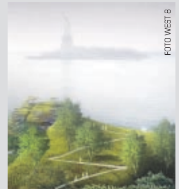
Impressie van het park.